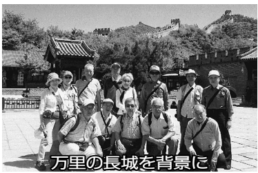
万里の長城を背景に