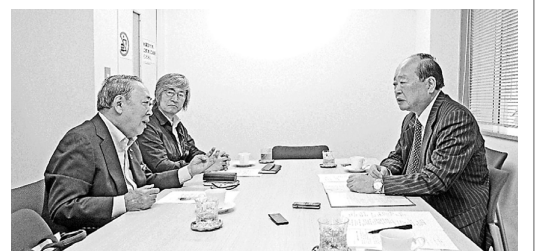
校友会最大の課題