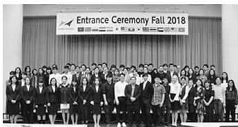
15カ国・地域からの新入生