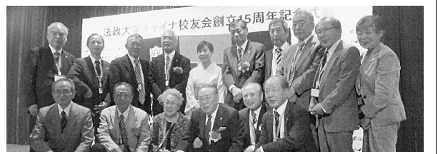
法政チャイナ校友会15周年記念式典会場