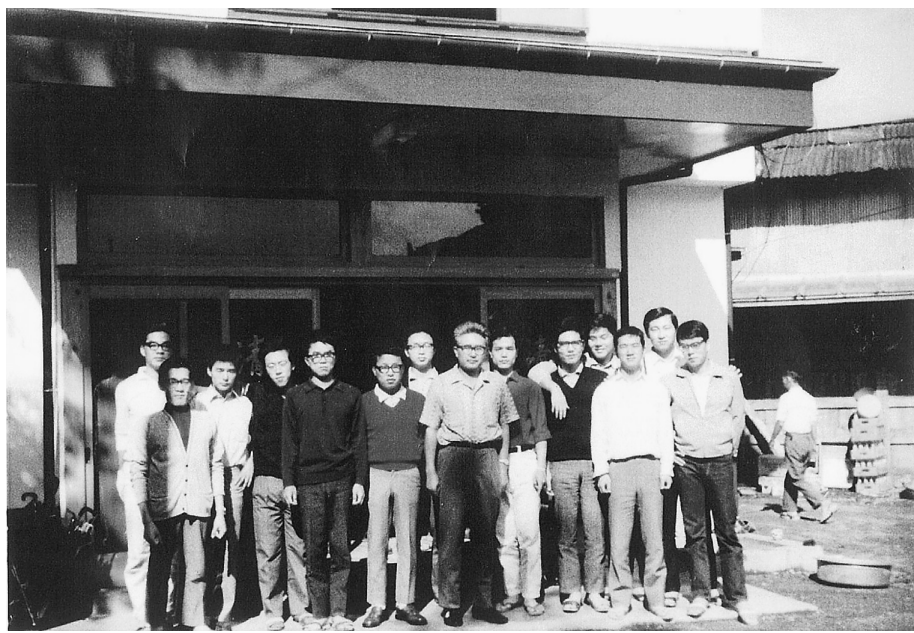
第1・2期生/昭和44年春合宿